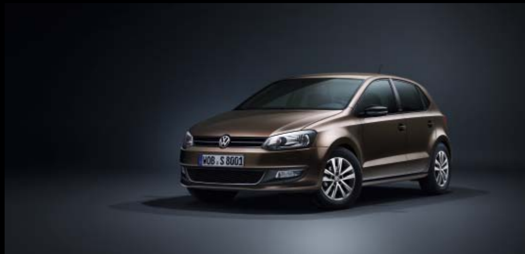
Polo Style 4-7

Auffallen, aber mit Stil. Das ist das Motto der neuen Sondermodelle Style. Von außen wie von innen schaffen sie es, mit attraktivem Design und zahlreichen Ausstattungen kleine und große Akzente zu setzen. Dabei bieten ausgewählte Materialien und attraktive Extras einen Komfort, der keine Wünsche offen lässt und jede Fahrt zu einem glänzenden Auftritt macht.