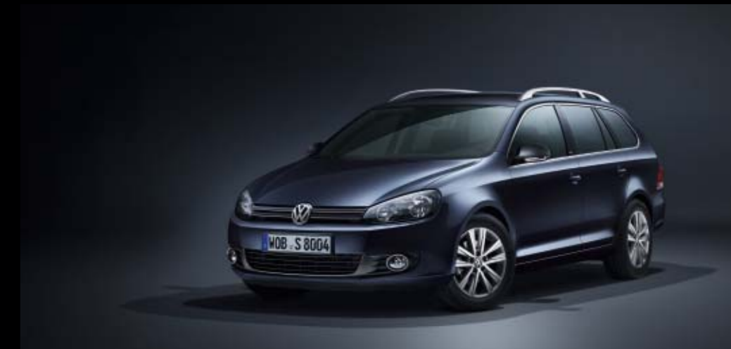
Golf Variant Style 16-19