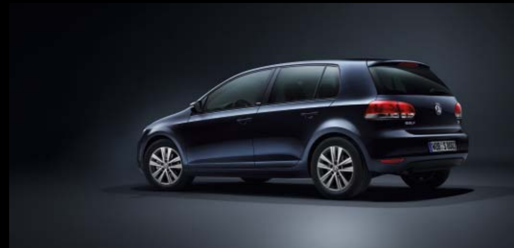
Golf Style 8-11