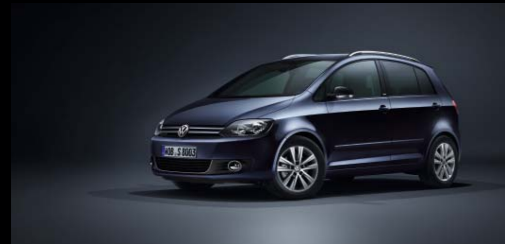
Golf Plus Style 12-15