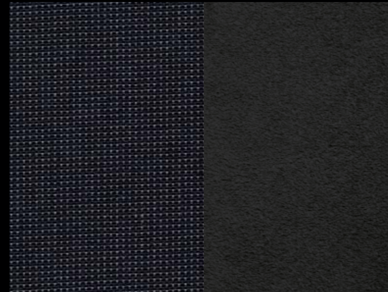
Sitzbezug „Austin Black Denim“/Alcantara Titanschwarz | 35

Die hier abgebildeten Lackierungen sind speziell für die Sondermodelle Style und als Sonderausstattung gegen Mehrpreis erhältlich. Sie können wählen zwischen Toffeebraun Metallic (für Polo Style, Golf Variant Style) und Moonlight Blue Perleffekt (für Golf Style, Golf Plus Style, Golf Variant Style). Die sonstigen Lackierungen entnehmen Sie bitte dem jeweiligen Hauptkatalog. Bei der Bestellung des Sondermodells in Deep Black Perleffekt sind die Außenspiegelgehäuse ebenfalls in Wagenfarbe lackiert.